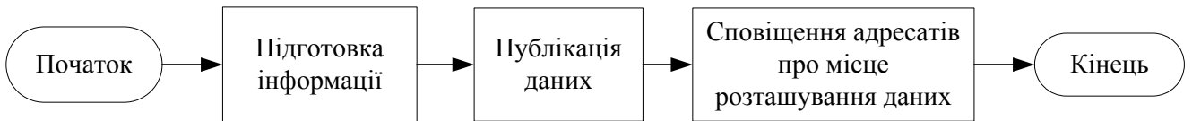
Рис 2. Схема узагальненого процесу підготовки та публікації інформації

Перетворена інформація набуває вигляду, що читається машиною, яку надалі будемо назвати даними. На кроці “Публікація даних” дані стають доступними адресатові шляхом їх розміщення на майданчику, через який він зможе їх отримати. Після того як дані розміщені на майданчику, автор повідомляє адресатові адресу місця розташування даних, зазвичай, у вигляді URL.