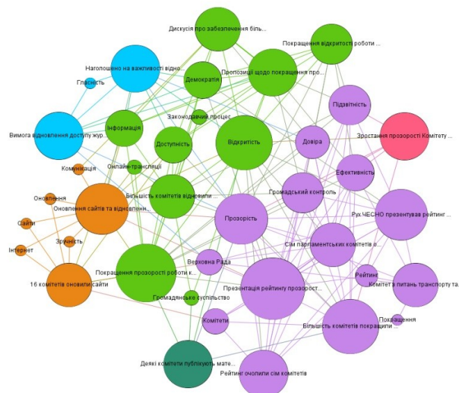
Рис. 3. Кластери в мережі подій у середовищі системи Gephi.

Крім того, у цій мережі враховувались визначені раніше причинно-наслідкові зв'язки між подіями. Цю мережа також спочатку було представлено як файл у форматі CSV, після чого її було завантажено у систему Gephi ( https://gephi.org ). У середовищі цієї системи проведено фільтрацію створеної мережі (вилучені всі вузли-листя із ступенем 1), а також кластеризацію за критерієм модулярності. Отриману мережа, що містить 39 вузлів і 149 зв'язків, наведено на Рис. 3, на якому кожному кластеру відповідає свій колір вузлів.